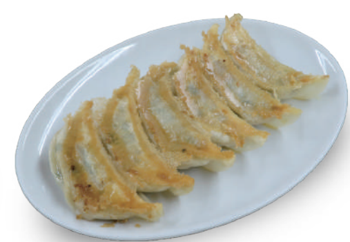
麺やしみず 480円 白菜とキャベツのバランスが良く、粗びき肉と合わせたジューシーでもっちりとした餃子 🐷🥬