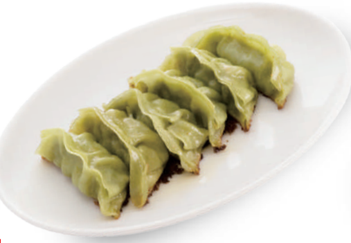
麺々市場 380円 皮も具材も県産ニラを練り込んでいる。野菜たっぷりの「にらっこ餃子」 🐷🥬