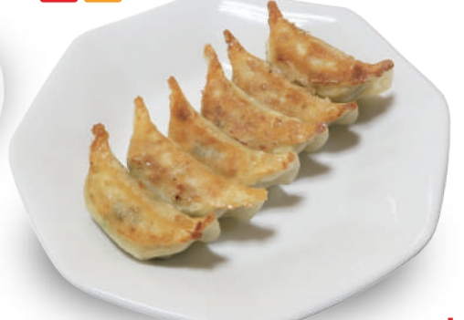
ぎょうざの笑平 290円 国産野菜と豚肉と鶏肉の旨みが詰まったショウガが効いてタレなしで旨い餃子 🐷🐔🥬