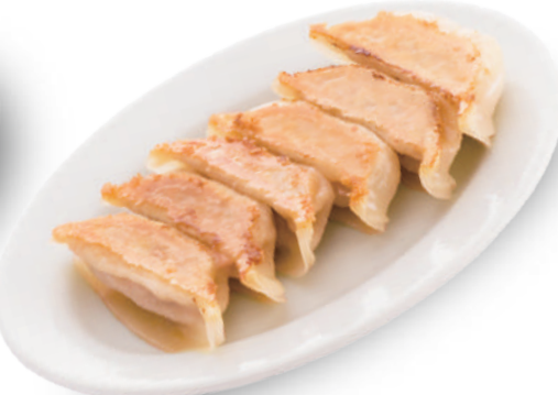
味一番 330円 皮は弾力がありもちもちで、アンは干し貝柱と味噌を加えて奥行きのある旨み 🐷🐔🐟🥬