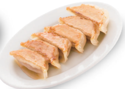
味一番 330円 皮は弾力がありもちもちで、アンは干し貝柱と味噌を加えて奥行きのある旨み 🐷🐔🐟🥬🌿