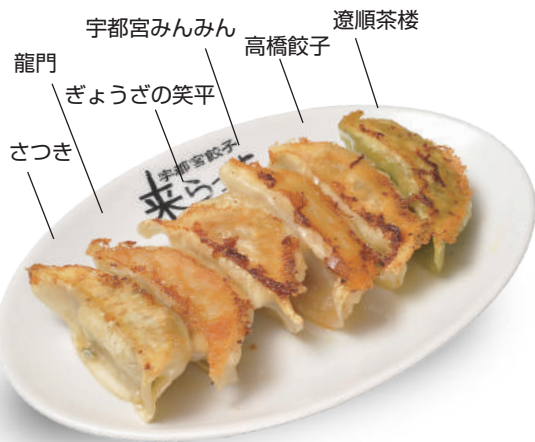
E盛り 520円 さつき・龍門・ぎょうざの笑平・宇都宮みんみん・高橋餃子・遼順茶楼の6店舗盛り合わせ！ 🐷🐔🐟🥬🌿