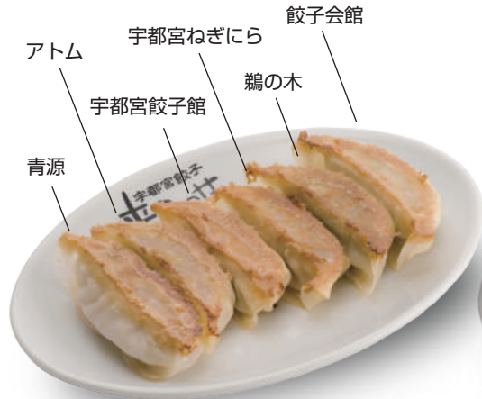
A盛り 520円 青源・アトム・宇都宮餃子館・宇都宮ねぎら・鵜の木・餃子会館の6店舗盛り合わせ！ 🐷🐔🐟🥬🌿