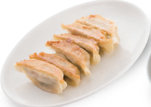
華 380円 地元産の小松菜やニラを刻み入れた、シャキシャキの歯ごたえの餃子 🐷🐔🌿