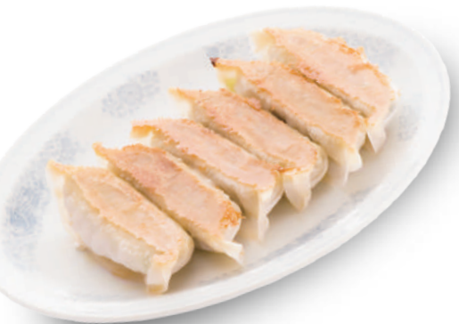
青源 390円 厳老舗味噌屋の特選餃子。厳選素材と味噌を加え深いコクが溢れる 🐷🐔🌿