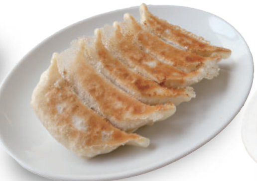
宇味家 460円 国内産の新鮮野菜とバランスの良い国産豚を使用し、厚めのもっちり皮で包んだ餃子 🐷🌿