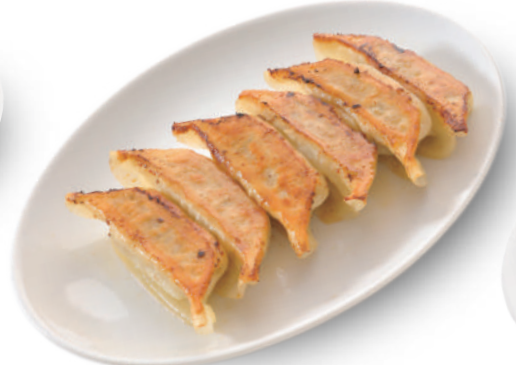
雄都水産 400円 風味豊かなえびのすり身や、国産野菜がたっぷり入った「えび餃子」 🐷🐔🐟🥬🌿