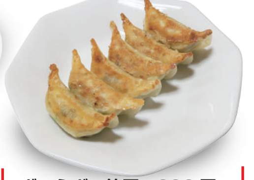
ぎょうざの笑平 290円 国産野菜と豚肉と鶏肉の旨みが詰まったショウガが効いてタレなしで旨い餃子 🐷🐔🌿