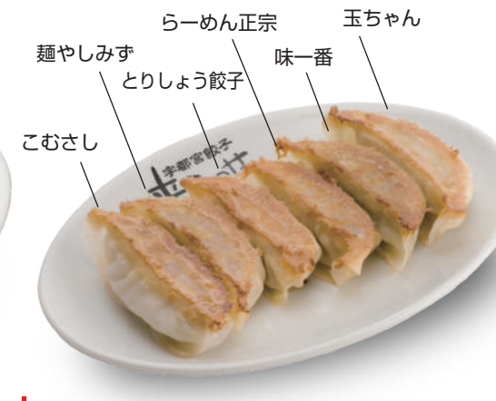
F盛り 520円 こむさし・麵やしみず・とりしょう餃子・らーめん正宗・味一番・玉ちゃんの6店舗盛り合わせ！ 🐷🐔🐟🥬🌿