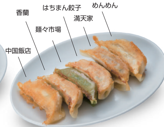
D盛り 520円 中国飯店・香蘭・麵々市場・はちまん餃子・満天家・めんめんの6店舗盛り合わせ！ 🐷🐔🐟🥬🌿