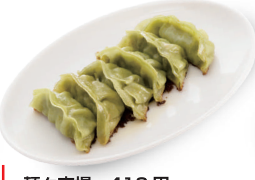
麵々市場 410円 皮も具材も県産ニラを練り込んでい。野菜たっぷりの「にらっこ餃子」 🐷🌿