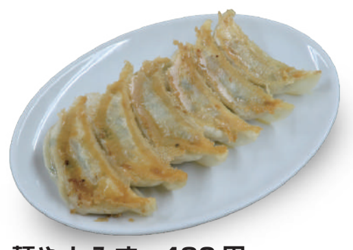
麵やしみず 480円 白菜とキャベツのバランスが良く、粗びき肉と合わせたジューシーでもっちりとした餃子 🐷🌿