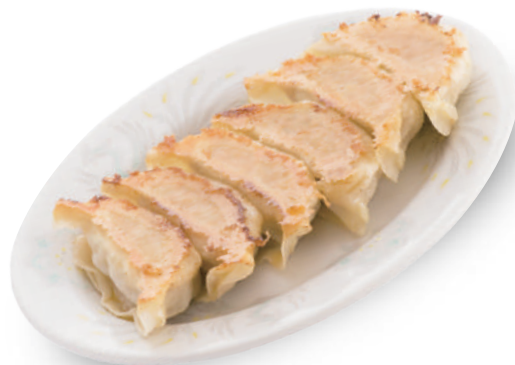
餃子会館 390円 無添加湯練りでもっちり皮と、脂身のバランスの良い国産豚がジューシー！ 🐷🐔🌿