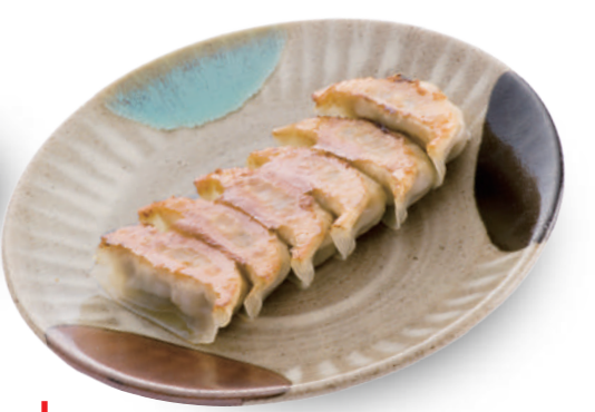
玉ちゃん 280円 那須産の豚肉と新鮮野菜がぎっしりと詰まった無添加の餃子。 🐷🐔🌿