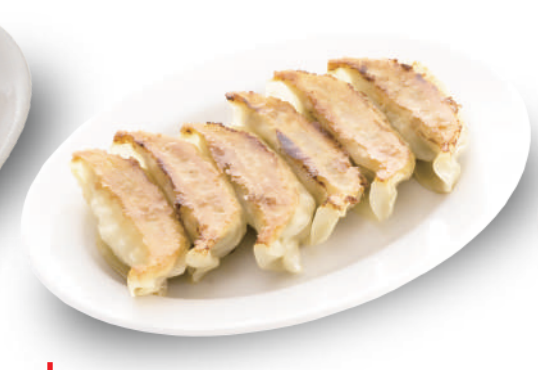
幸楽 270円 皮から自家製で、野菜の甘みが特徴。肉汁たっぷりですジューシーな餃子 🐷🐔🐟🌿