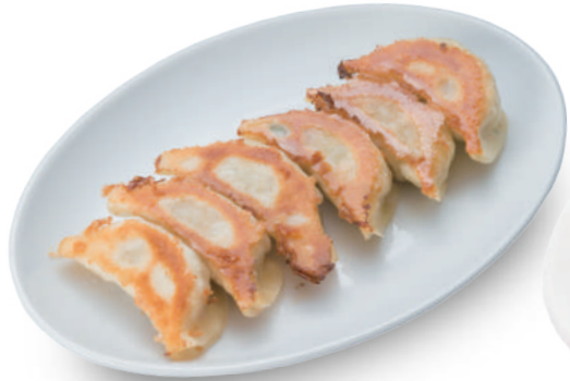
寿限無餃子 380円 キャベツを主とした新鮮野菜と、脂身のパランスの良い国産豚を使った無添加餃子 🐷🐔🌿