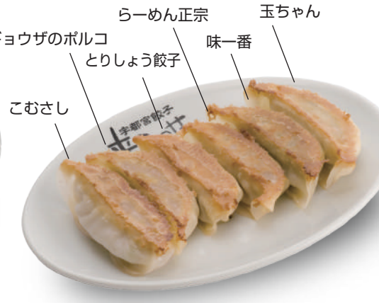
F盛り 440円 こむさし・ギョウザのボルコ・とりしょう餃子・らーめん正宗・味一番・玉ちゃんの6店舗盛り合わせ！ 🐷🐔🐟🥬🌿