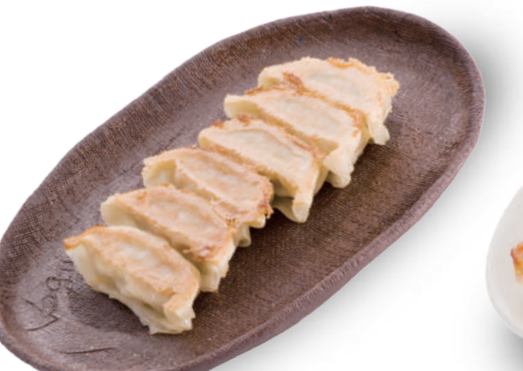
宇都宮ねぎにら餃子 420円 スタミナ野菜「ネギニラ」を使用。野菜本来の甘みが広がる本格派 🐷🐔🐟🌿