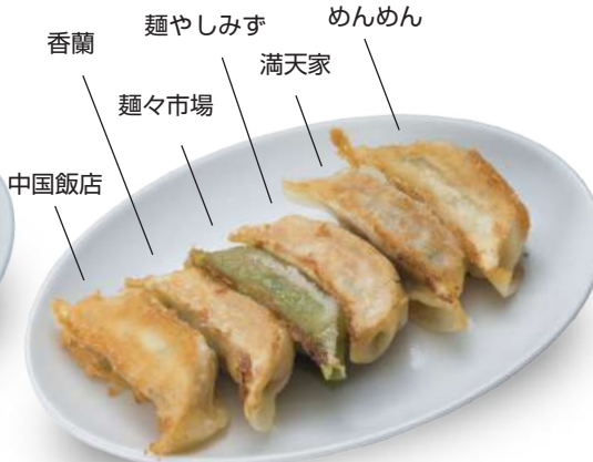
D盛り 440円 中国飯店・香蘭・麺々市場・麺やしみず・満天家・めんめんの6店舗盛り合わせ！ 🐷🐔🐟🥬🌿