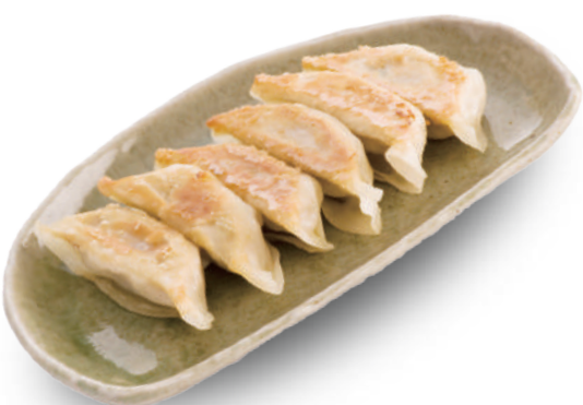
中国飯店 320円 ニンニク未使用で、シンプルなのに野菜の豊かな旨みが広がる奥深い巨匠の味 🐷🐟🥬🌿