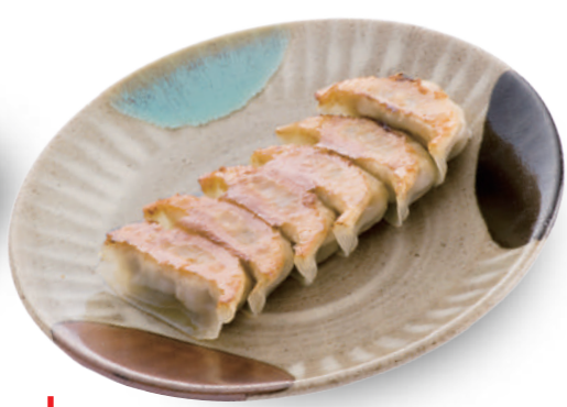
玉ちゃん 310円 那須産の豚肉と新鮮野菜がぎっしりと詰まった無添加の餃子。 🐷🐔🌿