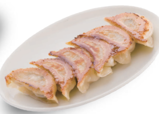
きりん 530円 こだわりの手ごねの皮はふた味違う！もちもち感と産直ニラがベストマッチ！ 🐷🌿