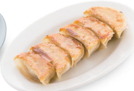
飯城園 380円 皮は厚めでもっちり。具材はキャベツとハクサイを使用してバランス絶妙！ 🐷🌿