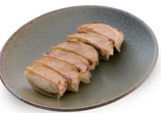
アトム 390円 オール国産にこだわり、新鮮野菜がたっぷり入っていて、とってもジューシー！ 🐷🐔🐟🌿