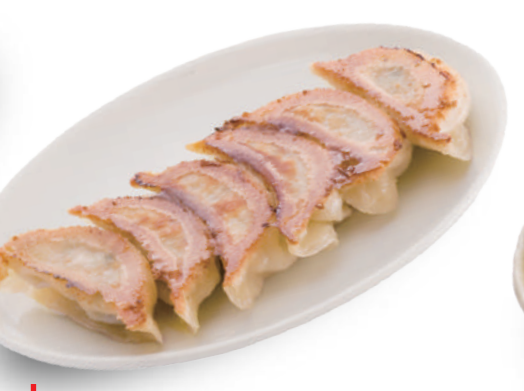
きりん 530円 こだわりの手ごねの皮はふた味違う！もちもち感と産直ニラがベストマッチ！ 🐷🌿