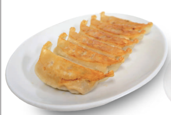
はちまん餃子 360円 研究を重ねたもちもち食感の皮に、下味がしっかりついた肉汁たっぷり餃子 🐷🐔🌿