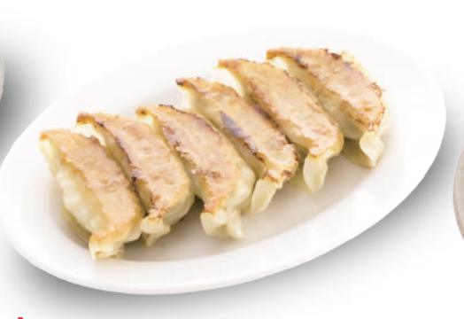
幸楽 320円 皮から自家製で、野菜の甘みが特徴。肉汁たっぷりですジューシーな餃子 🐷🐔🐟🌿