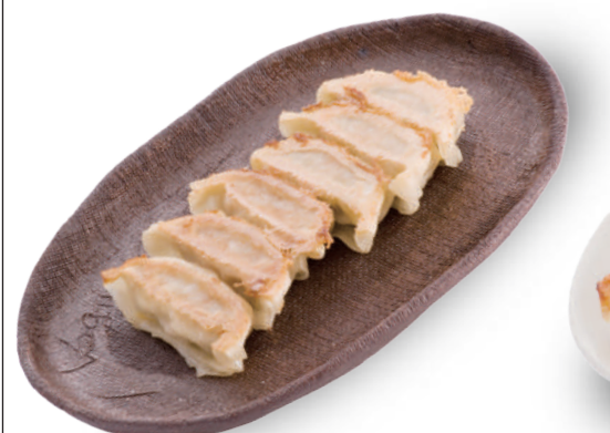
宇都宮ねぎにら餃子 450円 スタミナ野菜「ネギニラ」を使用。野菜本来の甘みが広がる本格派 🐷🐔🐟🌿