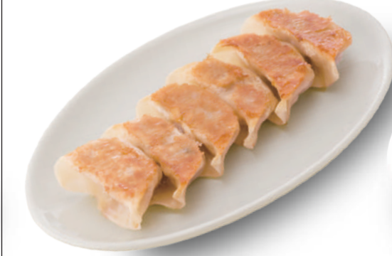
とんきつき 390円 県産豚肉をふんだんに使った、パリッと薄皮、中はジューシーな肉汁たっぷり 🥬🐷🐔🥬🌿