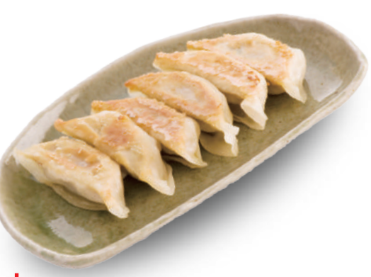
中国飯店 350円 ニンニク未使用で、シンプルなのに野菜の豊かな旨みが広がる奥深い巨匠の味 🐷🥬🐟🥬🌿