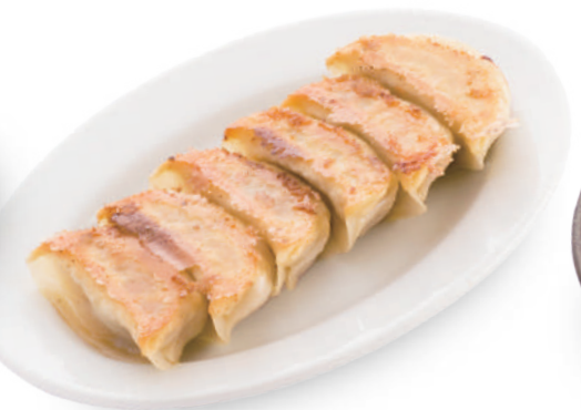
飯城園 380円 皮は厚めでもっちり。具材はキャベツとハクサイを使用してバランス絶妙！ 🐷🌿