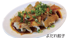
よだれ餃子 (四川風)