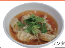
ワンタン風スープ餃子