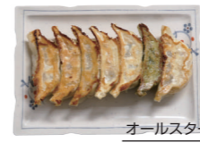
オールスター餃子