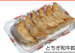
とちぎ和牛餃子【下野餃子】