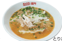
とりたんたんスープ餃子