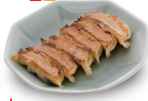
宇都宮みんみん 300円