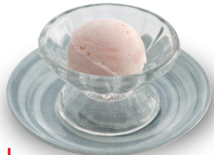
デザート 270円 (とちおとめジェラート)