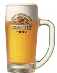
生ビール 550円 (麒麟新一番搾り)