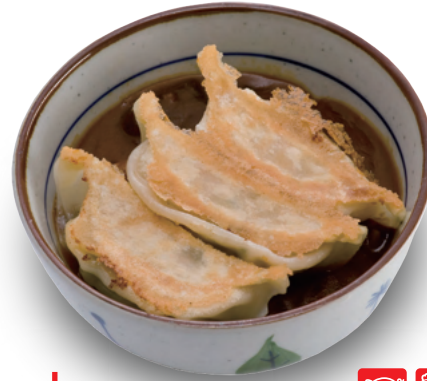
「来らせ」の カレー餃子丼 410円

宮島醤油のカレーと餃子がドッキング！ 宇都宮の新名物になるかも!?（餃子は味一番を使用）