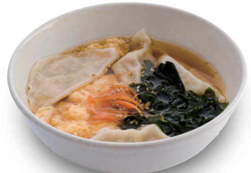
「来らせ」の 玉子スープ餃子 450円