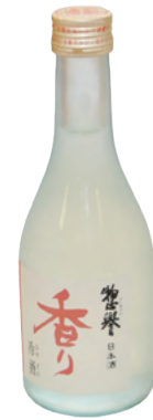
日本酒 890円 (惣誉 冷酒香り)

300ml アルコール分 15% 麴米すべてに山田錦を使用。キレの 良い味わいと、爽やかな香りの冷酒