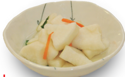
漬物 250円 (アキモのあとひき大根)