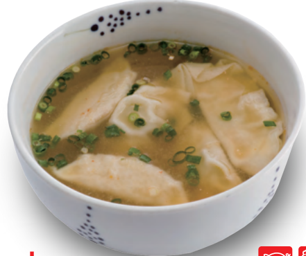
「青源」の 水餃子 500円